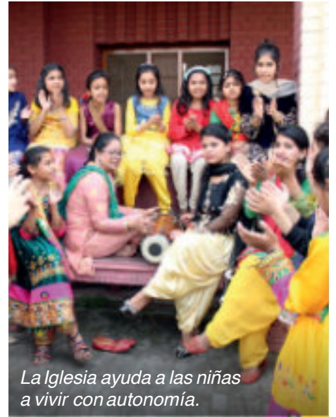
La Iglesia ayuda a las niñas a vivir con autonomía.

Además, los capuchinos de Lahore están poniendo en marcha un programa para 120 jóvenes cristianas.