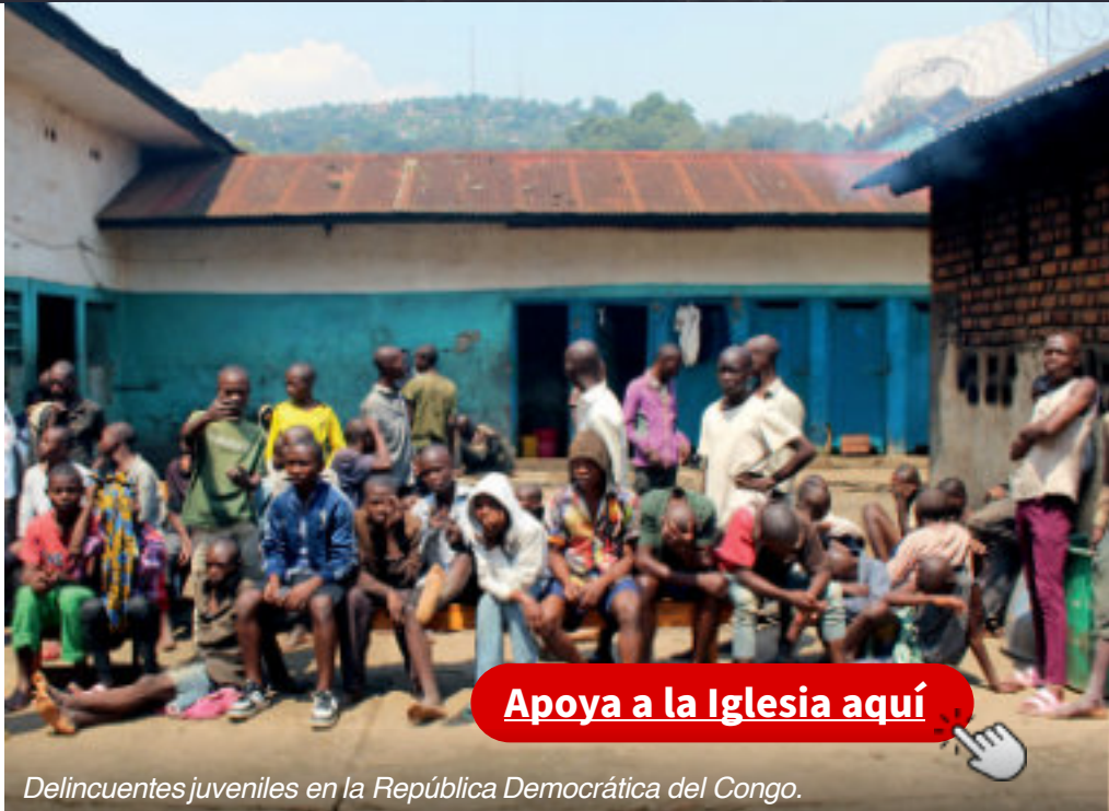
Delincuentes juveniles en la República Democrática del Congo.

Los actos tangibles de caridad a menudo hacen reflexionar incluso a quienes, en principio, no quieren tener nada que ver con la fe. “¿Por qué este sacerdote hace esto por nosotros?”, se preguntan cuando