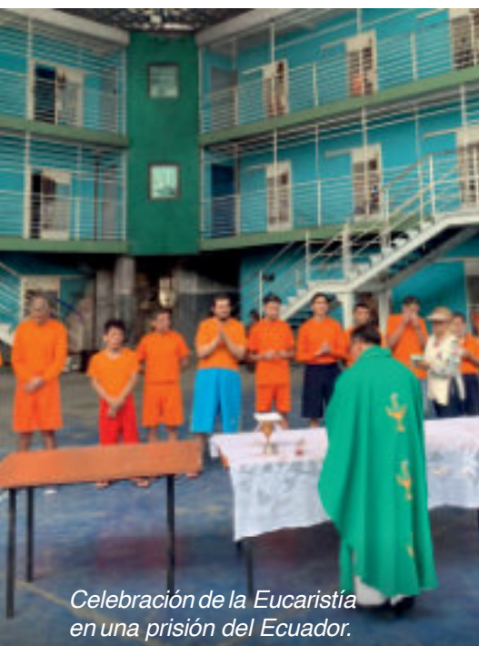
Celebración de la Eucaristía en una prisión del Ecuador.

¿Quieres contribuir a que la misericordia de Dios obre milagros de conversión en delincuentes arrepentidos?