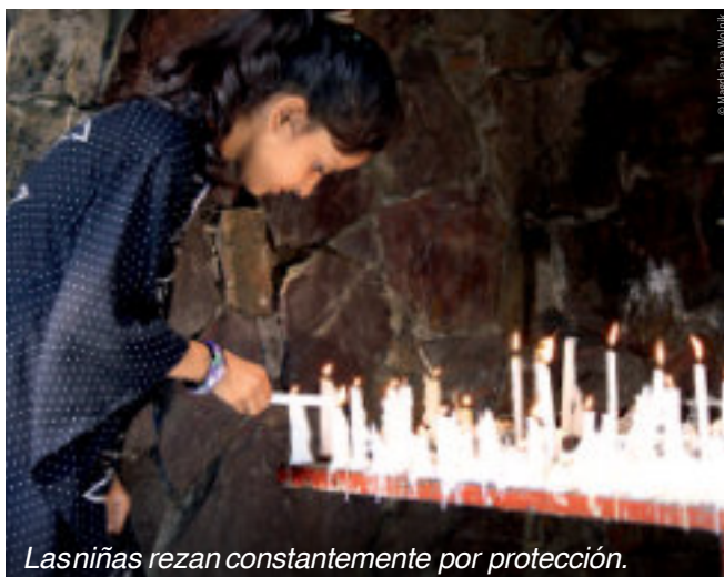
Las niñas rezan constantemente por protección.