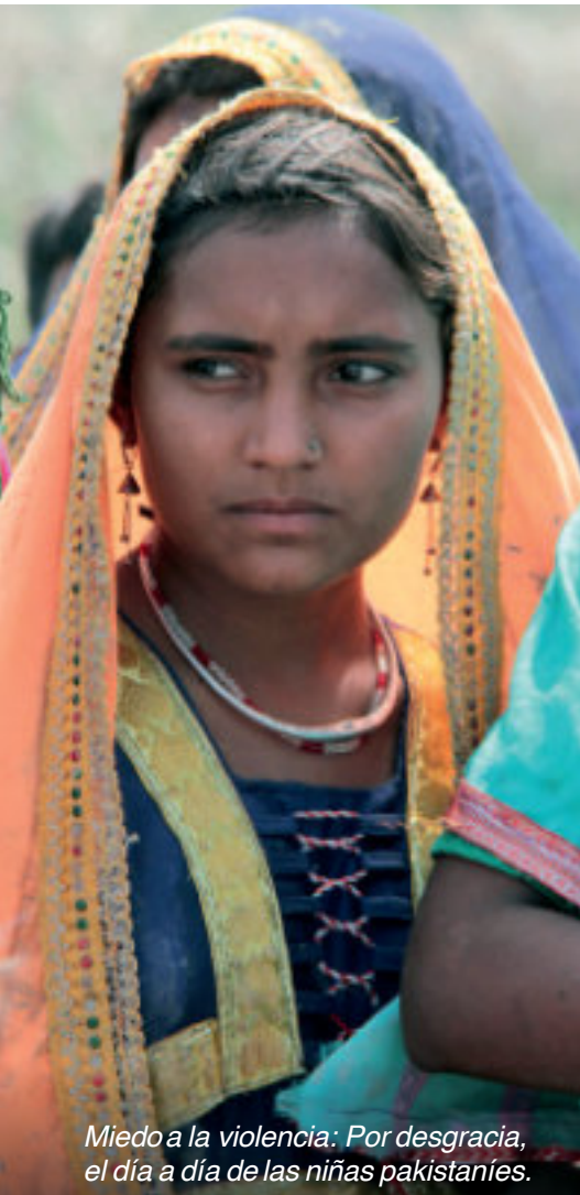
Miedo a la violencia: Por desgracia, el día a día de las niñas pakistaníes.

En el Evangelio, una y otra vez, son las mujeres las que se acercan a Jesús con la audacia de una gran fe para pedirle ayuda. La mujer que padecía flujo de sangre creía firmemente que el simple contacto con su manto la curaría... y así fue.